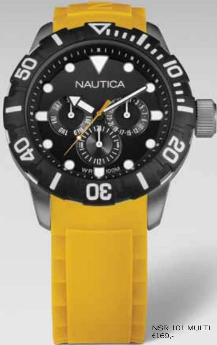
NSR 101 MULTI €169,-

www.juwelier-sl-design.nl www.jewellasersolution.com www.lasergraveren-lasermontage.com